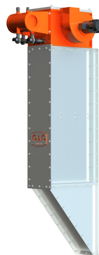
vertikálne prevedenie filtrov